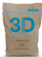
SACS 20 kg