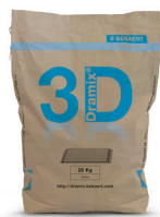
SACS 10 / 20 kg