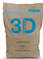
SACS 20 kg