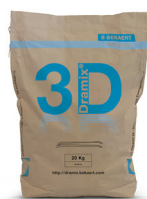
SACS 20 kg