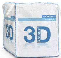
BIG BAG 1.100 kg