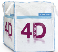
BIG BAG 1.100 kg