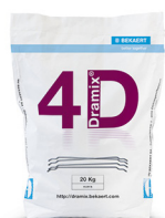
SACS 20 kg