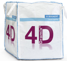
大袋 1.100 kg