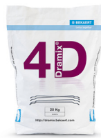
每袋 20 kg