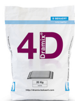
SACOS 20 kg