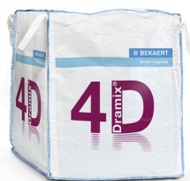
BIG BAG 1.100 kg