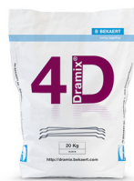
每袋 20 kg