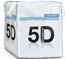
BIG BAG 1.100 kg