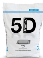
SACOS 10 / 20 kg