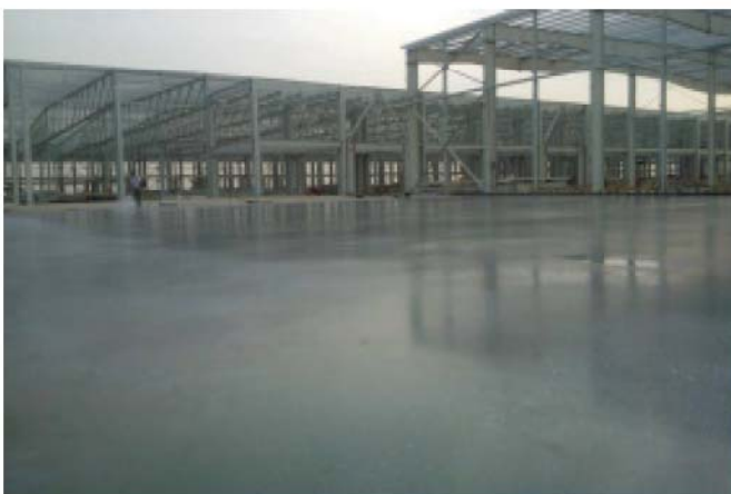
Bild 3. Fertige Oberfläche der Fundamentplatte eines Plattenfelds