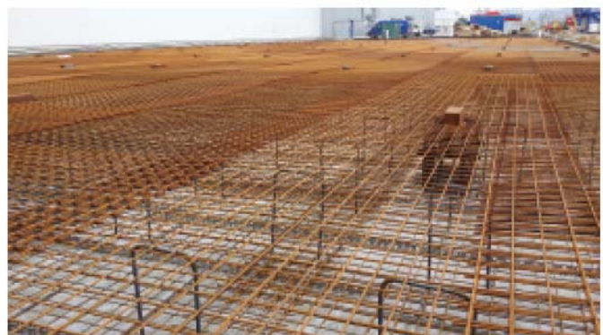
Bild 6. Fugenfreie Fundamentplatte: Grundbew.: 5,03cm 2 /m ob. und unt.