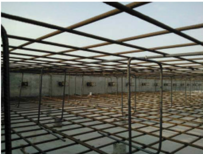
Bild 2. Entspannte Bewehrungsführung der Fundamentplatte

sich eine relativ gleichmäßige Lastverteilung auf der Platte. Im Vergleich zur Ursprungsberechnung konnte die Plattenstärke und der Bewehrungsgehalt deutlich reduziert werden. Insbesondere der Zeitvorteil gegenüber der Ursprungslösung kam dem Bauherrn sehr entgegen. Für die LEED Zertifizierung ergaben sich klare Vorteile mit der Alternativlösung. Über das Nebenangebot der Kombinationsbewehrung konnte sich das Unternehmen RCR Industrial flooring den Auftrag für die Ausführung der Fundamentplatte sichern. Die Ausführung der Platte erfolgte Anfang September 2015. Aufgrund der Betonierleistung und der klimatischen Bedingungen wurden Fugenfelder von 50m x 30m mit entsprechenden Schwerlastfugenprofilen vorgesehen. Bild 2 zeigt die entspannte Bewehrungsführung in der Platte und Bild 3 die fertige Oberfläche eines Plattenfelds.