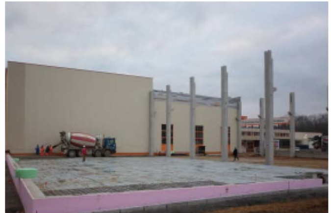
Bild 8. Einzige Betonstahlbewehrung unter den Aussteifungstürmen

Typische Industriefußböden aus Stahlfaserbeton gelten bereits seit vielen Jahren als Stand der Technik. Mit der DAfStb-Richtlinie Stahlfaserbeton werden die Vorzüge des Stahlfaserbetons nun auch verstärkt in Fundamentplatten für Industriebauten genutzt. Mit der bauaufsichtlichen Einführung der Richtlinie ist die Absicherung auf dem Gebiet der Normierung gegeben. Der Einsatz von leistungsfähigem Stahlfaserbeton in Fundamentplatten für Hochregallager in Silobauweise ermöglicht neben wirtschaftlichen Vorteilen eine Vielzahl von baupraktischen Vorzügen wie beispielsweise Zeitersparnis, Vereinfachung der Bewehrungsarbei-