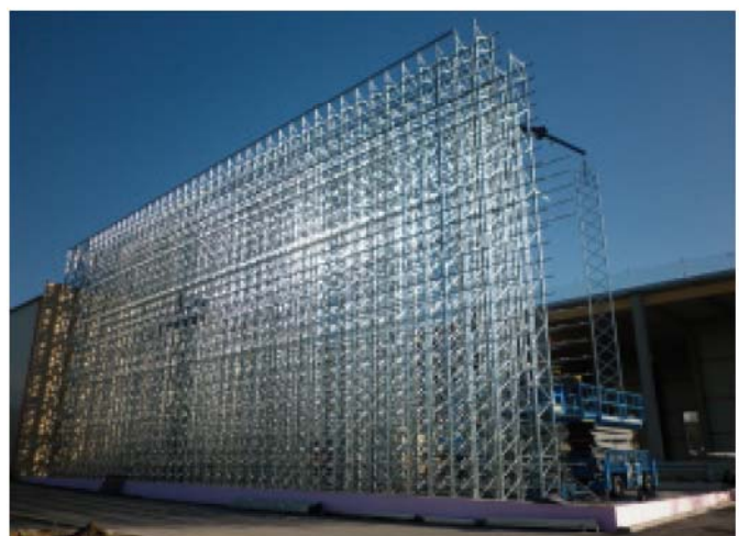
Bild 7. Regalsystem des Hochregallagers, Höhe ca. 20m